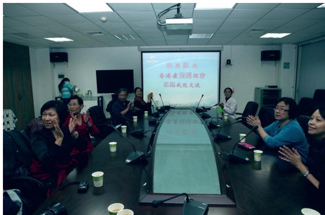
廣東省中醫院參觀交流