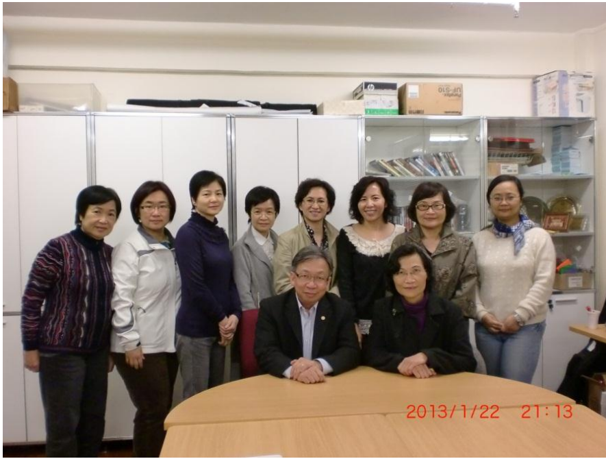
新任執委拍照留念