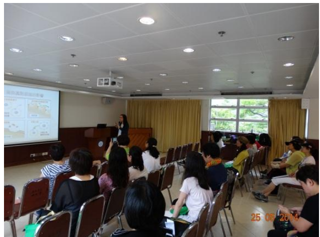
健康生活日營 營養師講座