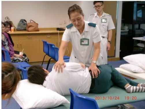
Therapeutic Transfer 講座